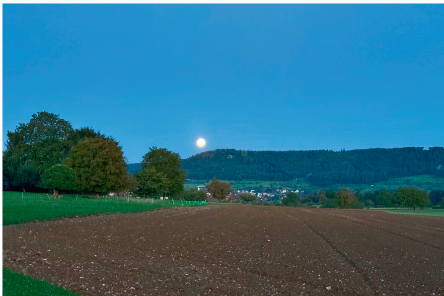
Der Herbst ist da ...

Unsere Gemeinde sucht engagierte Personen, die bereit sind, in der Sozialhilfebehörde mitzuwirken. Mit ca. fünf Sitzungen im Jahr, in denen über vorgefertigte Anträge im Bereich Asyl und allgemeine Sozialhilfeleistungen entschieden wird, leisten Sie einen wichtigen Beitrag für unser Gemeinwesen. Der Einsatz